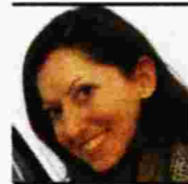
Της ΔΕΜΟΝΙΑΣ ΒΑΣΒΑΝΗ

«Ο Νίκος Γκάλης ήταν ο πρώτος ήρωάς μου των παιδικών μου χρόνων. Σαν παιδί μεγάλωσα με αυτόν. Γεννήθηκε το 1978 και είχα και την τύχη να είμαι στο γήπεδο στον τελικό του Ευρωμπάσκετ το 1987. Πιστεύω πως αυτός ο άνθρωπος ενέπνευσε μια ολόκληρη γενιά, είτε ήταν αθλητές, είτε όχι. Έχει μια ξεχωριστή