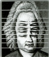
Bach Overscript by Christos Hatzis

original music. The listener is invited to make comparisons between the original and the derived materials, which, for that purpose, are always juxtaposed in close proximity as a sequence of 'sound slices'. In the middle movement there is emotional and personal involvement with the material, which, like in a