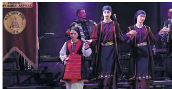
Στο Δημοτικό Ωδείο Λάρισσας πραγματοποιήθηκε το Φεστιβάλ Παραδοσιακών Συγκροτημάτων με την συμμετοχή 20 Πολιτιστικών Συλλόγων και Φορέων της Λάρισσας. Στο Φεστιβάλ Παραδοσιακών Συγκροτημάτων μετείχαν οι Σύλλογος Αργιθεσίων ν. Λάρισσας «Ο Άγιος Νικόλαος», Σύλλογος Ποντίων Λάρισσας, Σύνδεσμος Σαρακατσάνων ν. Λάρισσας, Σύλλογος Λιβαδιτών Λάρισσας «Ο Γεωργάκης Ολύμπιος», Πολιτιστικός-Εξωραϊστικός Σύλλογος Αμπελοκαίων Λάρισσας, Μ.Ε.Σ. Αγίου Θωμά, Χορευτικός Όμιλος Λάρισσας Σύλλογος Βερδικουσιωτών ν. Λάρισσας, Πολιτιστικός Σύλλογος Μικρασιατών ν. Λάρισσας, Μορφωτικός Σύλλογος Γαλιάνης, Πολιτιστικός Σύλλογος Παλιννοστούντων Ποντίων Λάρισσας «Ο Πόντος», Μ.Ε.Σ. Πέρα Μακαλά, Μορφωτικός Λαογραφικός Σύλλογος «Θεόκλητος Φαρμακίδης», Μικρασιατικός Σύλλογος Βουναίων «Η καθ' ημάς Ανατολή», Σύλλογος Γυναικών Γερακαρίου Αγιάς, Σύλλογος Ομορφοκωρίου Λάρισσας, Πολιτιστικός Χορευτικός Όμιλος Αγίου Αθανασίου «Χορογούγια», Μ.Ε.Σ. Χερμαδίου και Ομάδα Ελληνικών Παραδοσιακών και Λαϊκών χορών Διαχρονικού Συλλόγου Λάρισσας «Θέμις εν χορώ». Οι εκδηλώσεις έγιναν σε συνεργασία με την Ιερά Μητρόπολη Λαρίσσης και Τυρνάβου, το Διαχρονικό Μουσείο Λάρισσας, το Θεσσαλικό Θέατρο, τον Σύλλογο Φίλων Διαχρονικού Μουσείου Λάρισσας και τον Όμιλο Αγωνιστικού Μπαζιζ Λάρισσας στο πλαίσιο του φιλικό-πολιτιστικού φεστιβάλ «Ο Άν Βασίλης άρνησε μία μέρα».