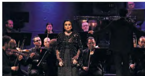
Την Καρνοφυλιά Καραμπέτι υποδέχτηκε η Λάρισσα στην αίθουσα συναυλιών του Δημοτικού Ωδείου Λάρισσας σε μία μοναδική συναυλία στο πλαίσιο του φεστιβάλ Μουσικότροπο. Μαζί της ήταν και η Κρατική Ορχήστρα Θεσσαλονίκης υπό τη διεύθυνση του πολυσταδίου διακεκριμένου μαέστρου και τσεμπάλιστα Μάρκελλου Χρυσόπουλου.